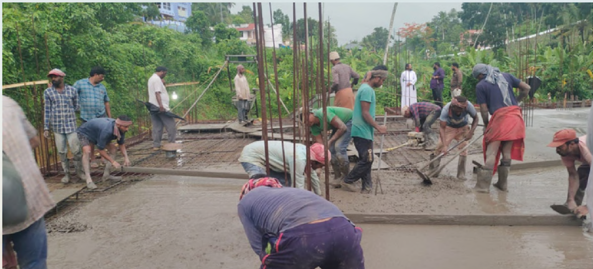
Completion of Ground Floor Concreting works