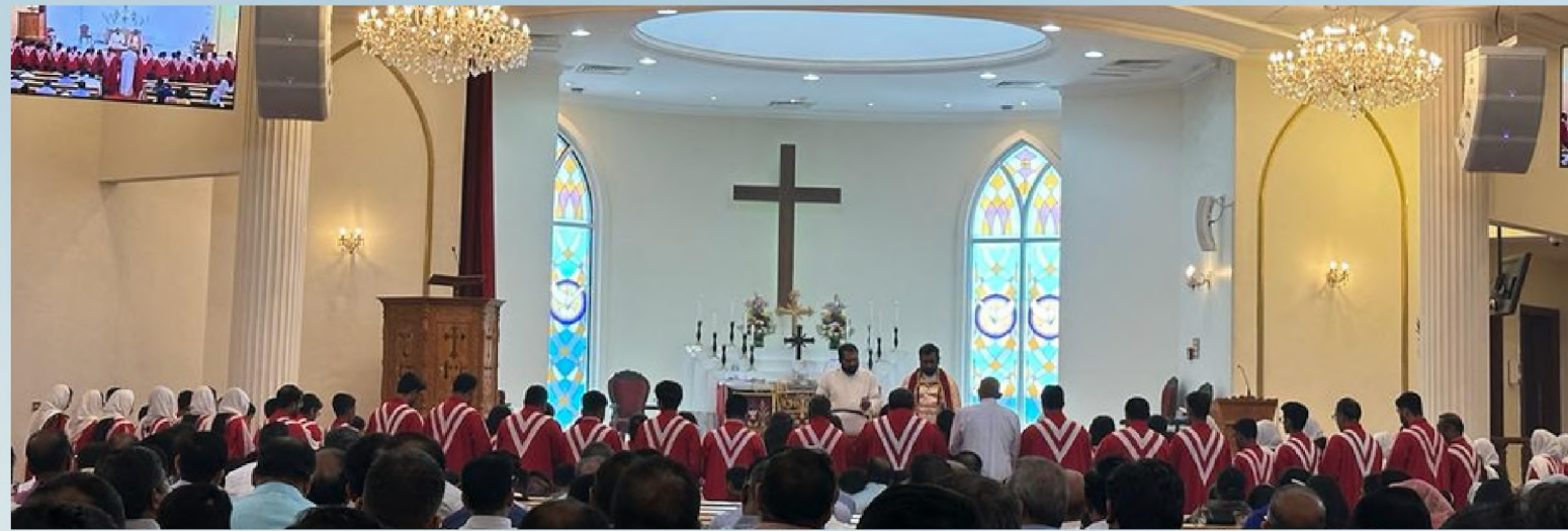
Dedication of our Parish Choir on Sunday 28th May, 2023